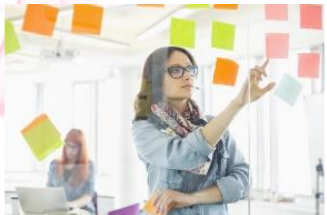
Generar un entorno que favorezca la creatividad

Productos o servicios revolucionarios: Las grandes ideas que llevan a productos revolucionarios no surgen ni la primera ni la segunda vez que uno se propone crearlos, pero si ponemos el foco en ello, al final terminan apareciendo